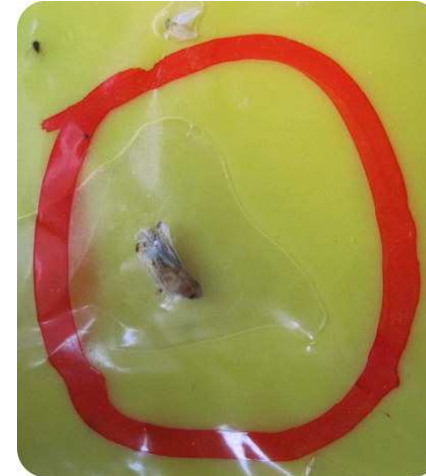
Adulto di scafoideo su trappola cromotattica